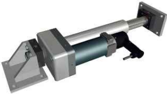
EMS22型推动器 最高推力2250N，行程最长195mm