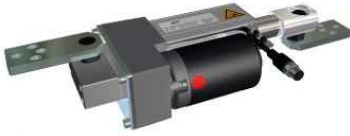
EMS18型推动器 最高推力840N，行程最长200mm