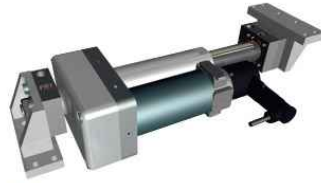
EMS21型推动器 最高推力1680N，行程最长195mm