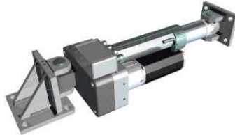
EMS23型推动器 最高推力9000N，行程最长300mm